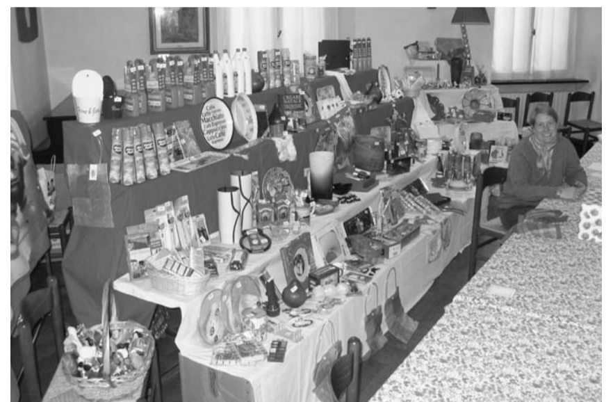
Nelle foto: Bazar, dolci, Bratwurst e Cervelat (sotto) per tutti.

Sabato 10 Novembre, un grande numero di soci grandi e piccini, graditi amici, ex-allievi ed insegnanti della Scuola Svizzera e tanti giovani hanno movimentato i locali del Circolo. Gradevole traffico in amicizia... qualche chiacchiera in coda... ritrovarsi per degustare insieme la "rinomata" grigliata di bratwurst e cervelat (originali CH!) servita con insalata di patate... il tutto preparato da abili soci...!