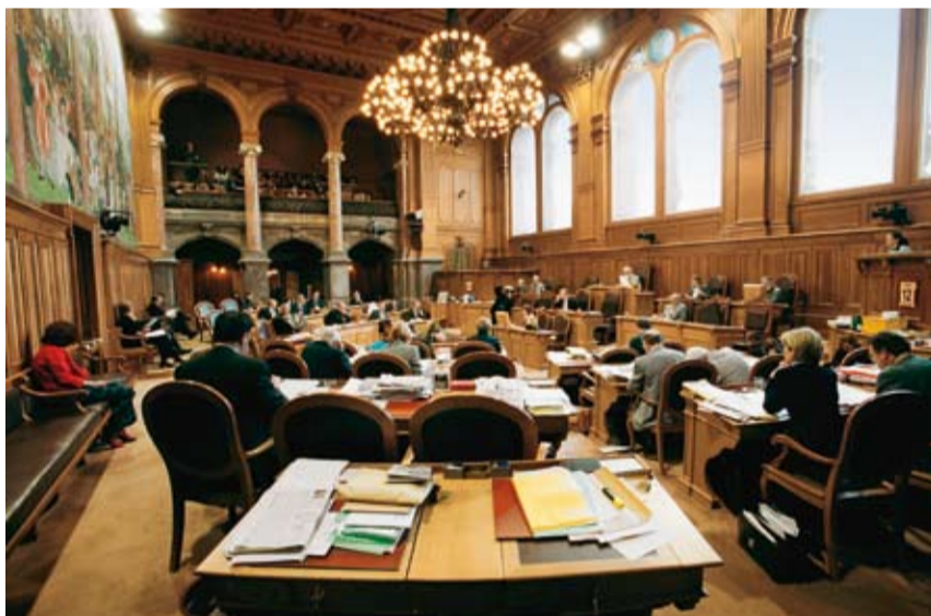
Una seduta del Consiglio degli Stati, la Camera dei Cantoni.

L'elezione dei consiglieri agli Stati è però un'elezione particolare, nella quale contano molto di più le persone e gli interessi cantonali. Inoltre, la formula dei due rappresentanti per cantone favorisce una costellazione politica molto diversa da quella del Nazionale.