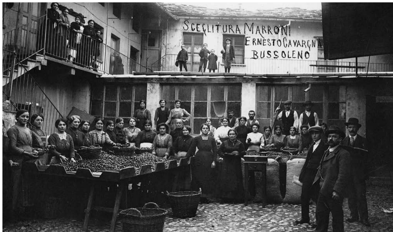
Scena di gruppo con operai della ditta di marroni fondata da E. Cavargna Bontosi.