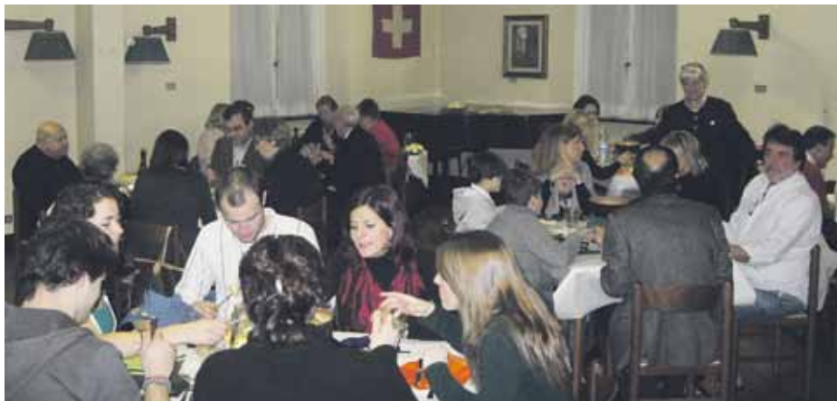
Soci del Circolo e famigliari gustano la tanto attesa fondue.

Venerdì 12 febbraio si è svolta la tanto attesa fondue. La risposta dei nostri cari Soci e degli immancabili Amici è stata veramente di grande soddisfazione per gli organizzatori.