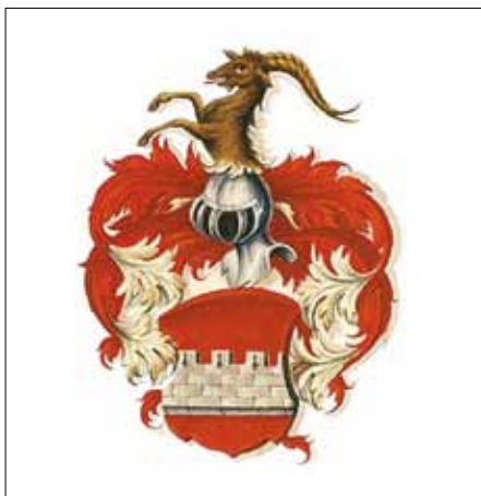
Lo stemma della famiglia.

Una curiosità... genealogica straordinaria, che ha quasi dell'incredibile, la longevità delle generazioni Auf der Maur. Un albero genealogico che poche famiglie possono eguagliare. Le prime tracce di questo cognome, il cui significato è "sopra il muro", risalgono addirittura ai primi decenni del 1200. Gli Auf der Maur (uff der Mur) sono di origine contadina e provengono dal canton Svitto (Svizzera) e precisamente dall'azienda agricola «Mur» di Oberschönenbuch, Svitto.