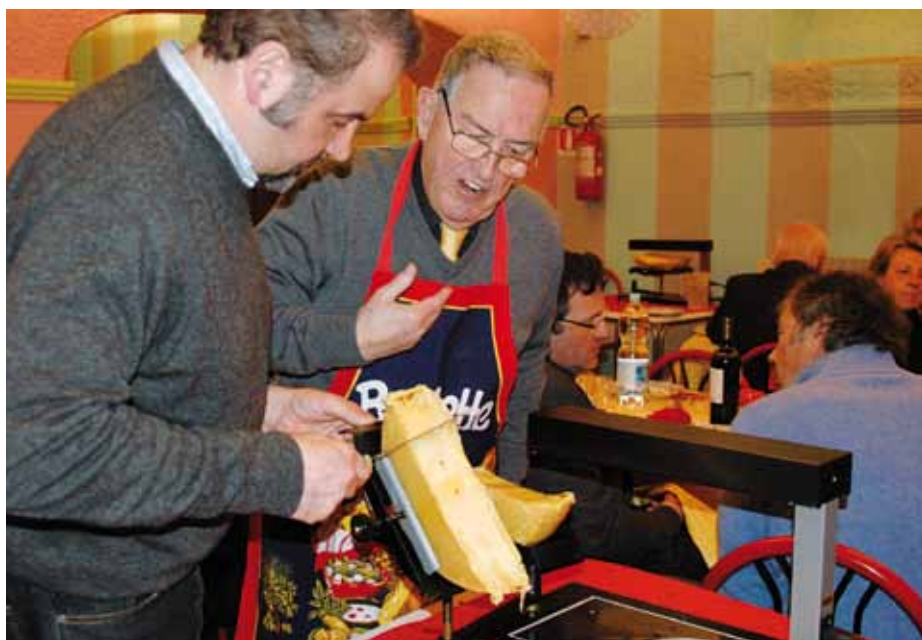
Un momento tipico della recente «raclette» al Circolo Svizzero.

di Cesarea, stimato consigliere dell'imperatore Costantino. Fu proprio Costantino a far erigere nel 326 una grandiosa basilica, meglio una memoria, che aveva il centro dell'abside del presbiterio coincidente con il sepolcro del primo papa. Per eseguire questa opera fu necessario in un certo qual senso profanare la necropoli 'pagana' interrandola e colmando il dislivello del terreno in modo da posizionarvi al di sopra la nuova basilica, rispettando il livello delle ossa di Pietro. Sopra il trofeo di Gaio Costantino fece elevare una edicola in marmo pavonazzetto e porfido, poi papa