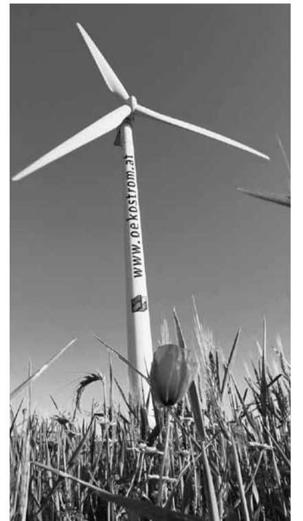
Produzione di energia alternativa.

Le spese per il combustibile costituiscono il 72% dei costi di produzione, il che significa una grande dipendenza dal prezzo del gas naturale. "Più i prezzi del gas sono incerti, più quelli dell'elettricità lo saranno a loro volta" (Avenir Suisse). E che ne è dell'approvvigionamento della Svizzera in gas naturale, che copre il 12% dell'insieme del consumo d'energia? "Il nostro