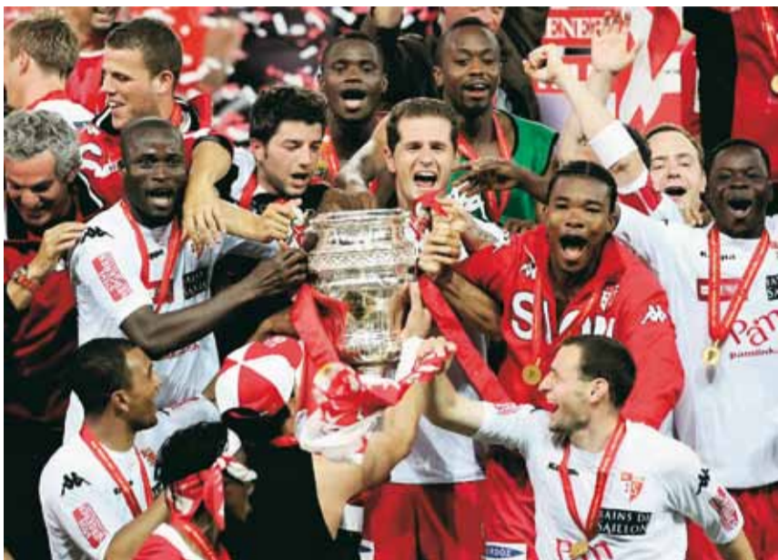
I giocatori del Sion festeggiano l'11ª Coppa Svizzera, appena conquistata.