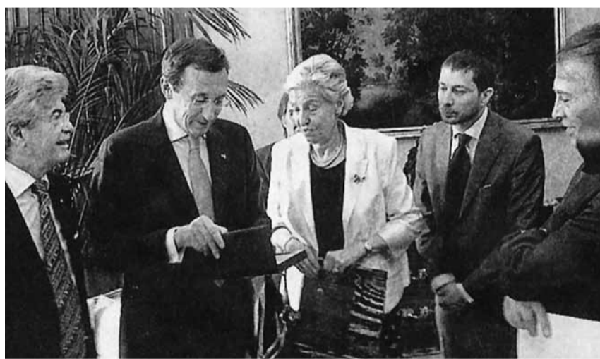
Chiara Simoneschi-Cortesi a colloquio con l'omologo Gianfranco Fini.

La presidente del Nazionale ha anche colto l'occasione per visitare la Scuola svizzera di Roma e la Guardia Svizzera in Vaticano. In campo parlamentare le collaborazioni tra Svizzera e Italia, che intrattengono relazioni diplomatiche dal 1861, sono ottime, come dimostrano i precedenti incontri tra presidenti e la creazione di una