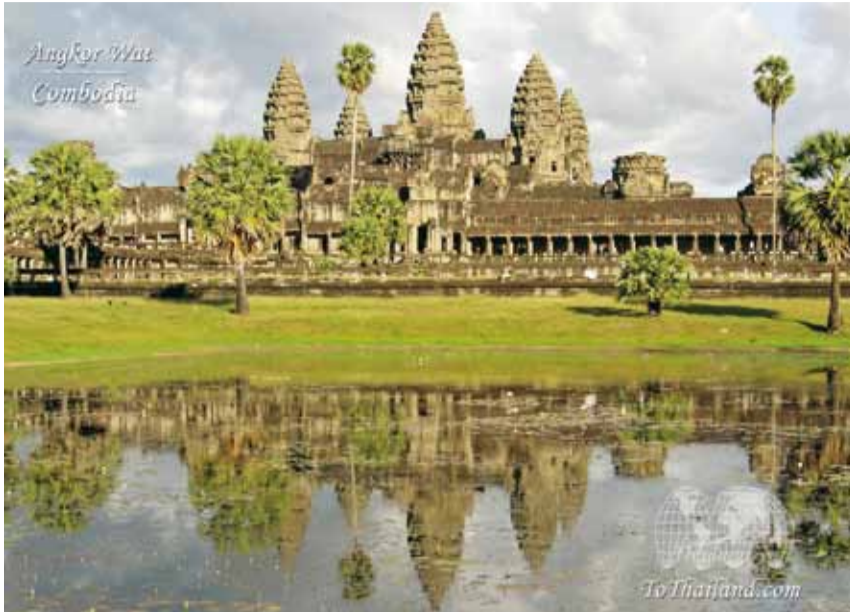
Il Tempio di Angkor Wat, uno dei più celebri monumenti cambogiani.

Il nostro esperto conferenziere ha tracciato innanzitutto per sommi capi la travagliata storia della Cambogia ricordando lo splendore dell'impero Khmer fra il 900 ed il 1300, che ha lasciato quella meravigliosa documentazione archeologica che è stata l'argomento principale della serata. Alla caduta dell'impero è seguito un lungo e oscuro periodo medioevale di guerre, conflitti e occupazioni da parte dei vietnamiti e dei thailandesi, i quali fortunatamente trascurarono tutta la zona archeologica la quale fu così completamente sepolta da una fitta vegetazione tropicale. Durante il 1800 l'allora casa regnante cambogiana fece un accordo di protettorato con la Francia. Un archeologo francese scoprì allora l'esistenza dei meravigliosi monumenti khmer e così si iniziò la deforestazione della zona. Alla fine del 1800 vi fu