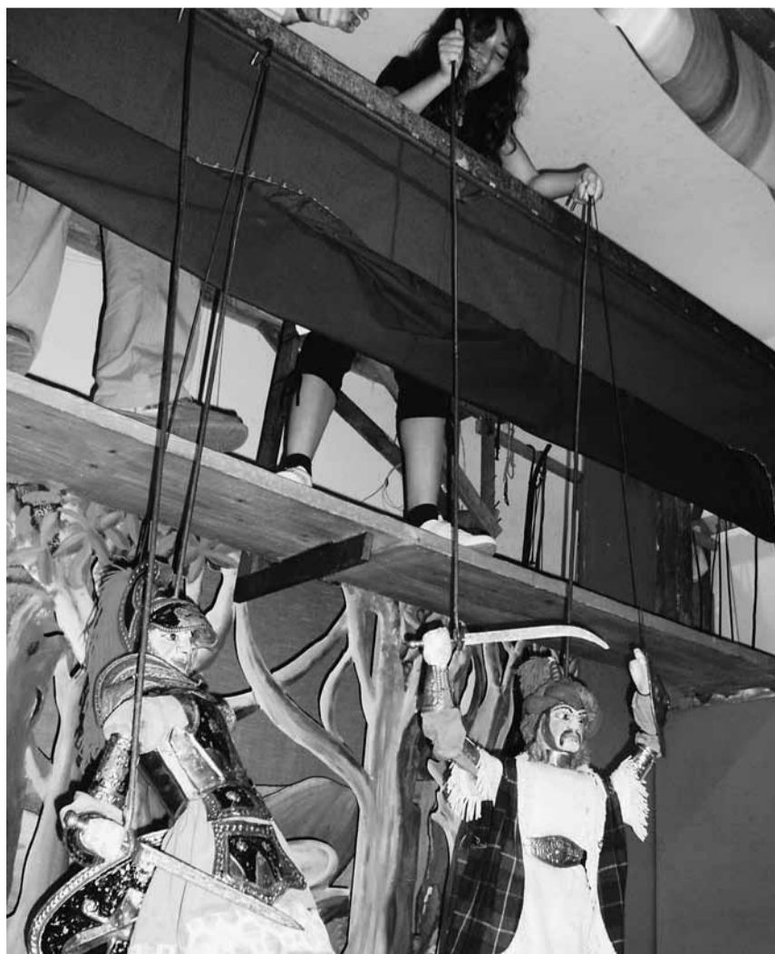
Gli allievi si cimentano nel difficile mestiere di «Puparo».

oltre 25 chili. È stato difficile uscire dal museo, visto che tutti i bambini volevano far "ballare" e combattere i guerrieri appesi.