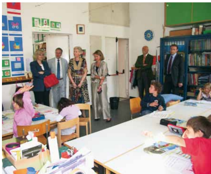
Carla Simoneschi-Cortesi beim Besuch einer Schulklasse in Rom.

Der Unterricht hatte bereits begonnen, als am 12. Mai 2009 um 9.00 Uhr die Nationalratspräsidentin Frau Simoneschi-Cortesi in der Schweizer Schule Rom eintraf. Ihre vielen Fragen, ihr grosses Interesse am Schulalltag, an den Bildungszielen und speziell an unserem ortsangepassten Modell der Basisstufe freuten uns sehr. Es gelang unserem Gast aus dem Bundeshaus in jeder besuchten Klasse den Kontakt zu den Kindern herzustellen. Bei Kaffee und