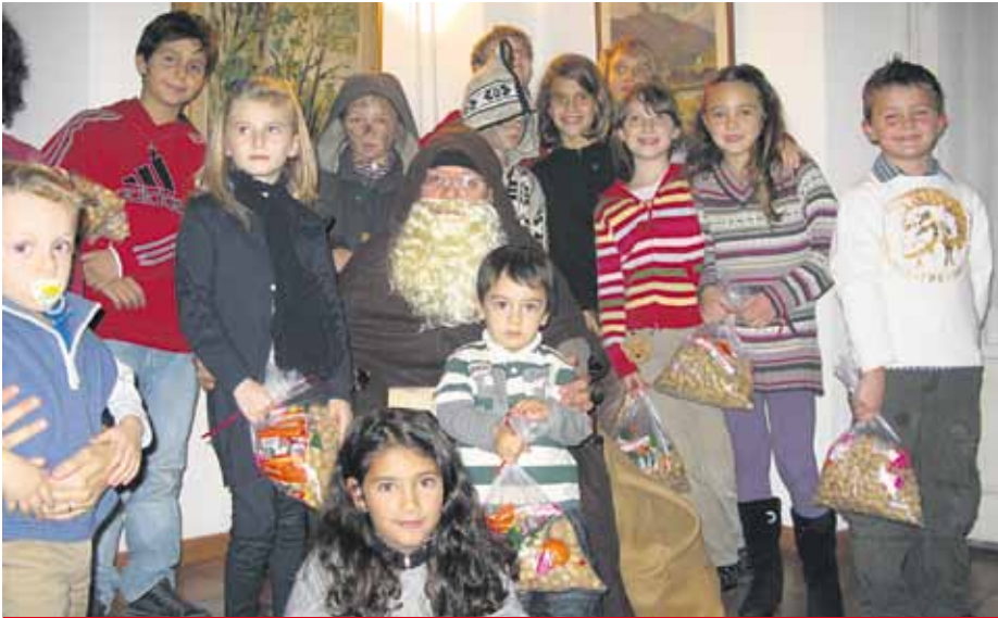
Il «Samichlaus» con i bambini al Circolo Svizzero durante la festa del 6 dicembre.

Com'è ormai tradizione, è tornato al Circolo Svizzero il Samichlaus, tanto atteso dai bambini.