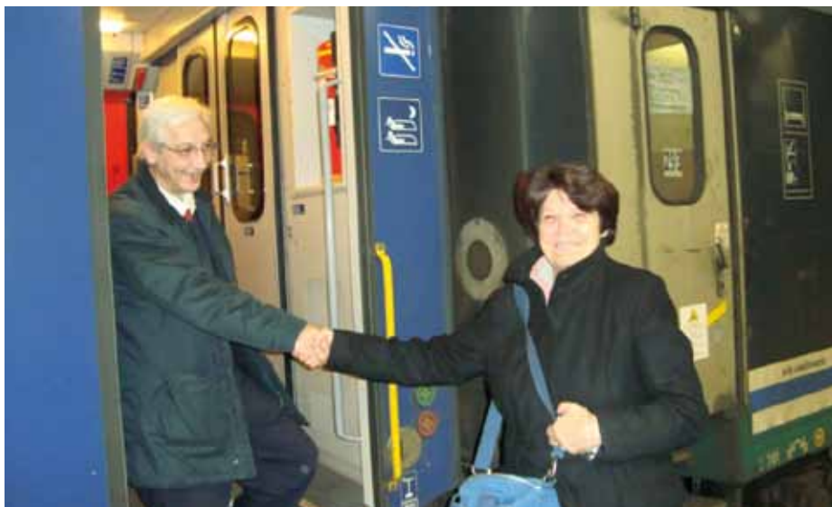
Il «Luna» era un treno molto apprezzato dagli Svizzeri di Roma.

http://www.mapetition.ch/signatures.php?idsig=S4173JjHM86FwBJ3m8AT Per ulteriori informazioni è possibile scrivere all'indirizzo e-mail: vivaeuronight@gmail.com .