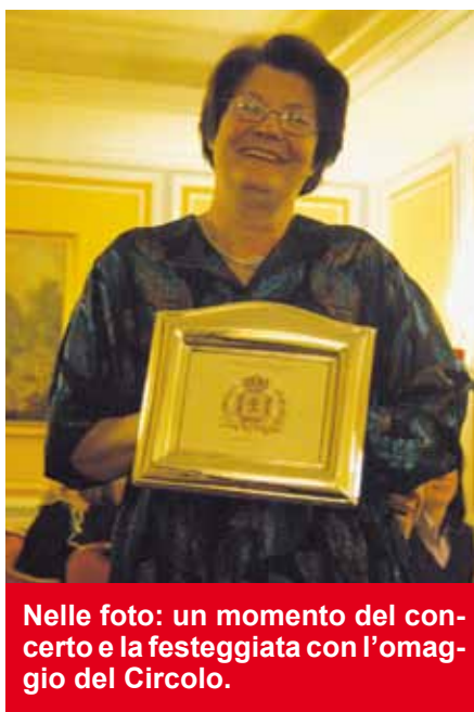
Nelle foto: un momento del concerto e la festeggiata con l'omaggio del Circolo.

che potrà essere osservata durante la visita, l'abbigliamento deve essere idoneo al sacro luogo: per gli uomini pantaloni lunghi; per le donne gonne sotto il ginocchio o pantaloni. Spalle coperte per tutti. A tutela della zona archeologica e del luogo sacro, durante la visita è vietato portare oggetti ingombranti (valigie, zaini, borse, apparecchi fotografici...). Il visitatore dovrà depositare detti oggetti prima di raggiungere l'Ufficio Scavi. È disponibile il deposito della Basilica, che è raggiungibile dopo il controllo di polizia e che offre una custodia gratuita con personale della Basilica. Sul sito http://www.vatican.va/various/basiliche/ne-